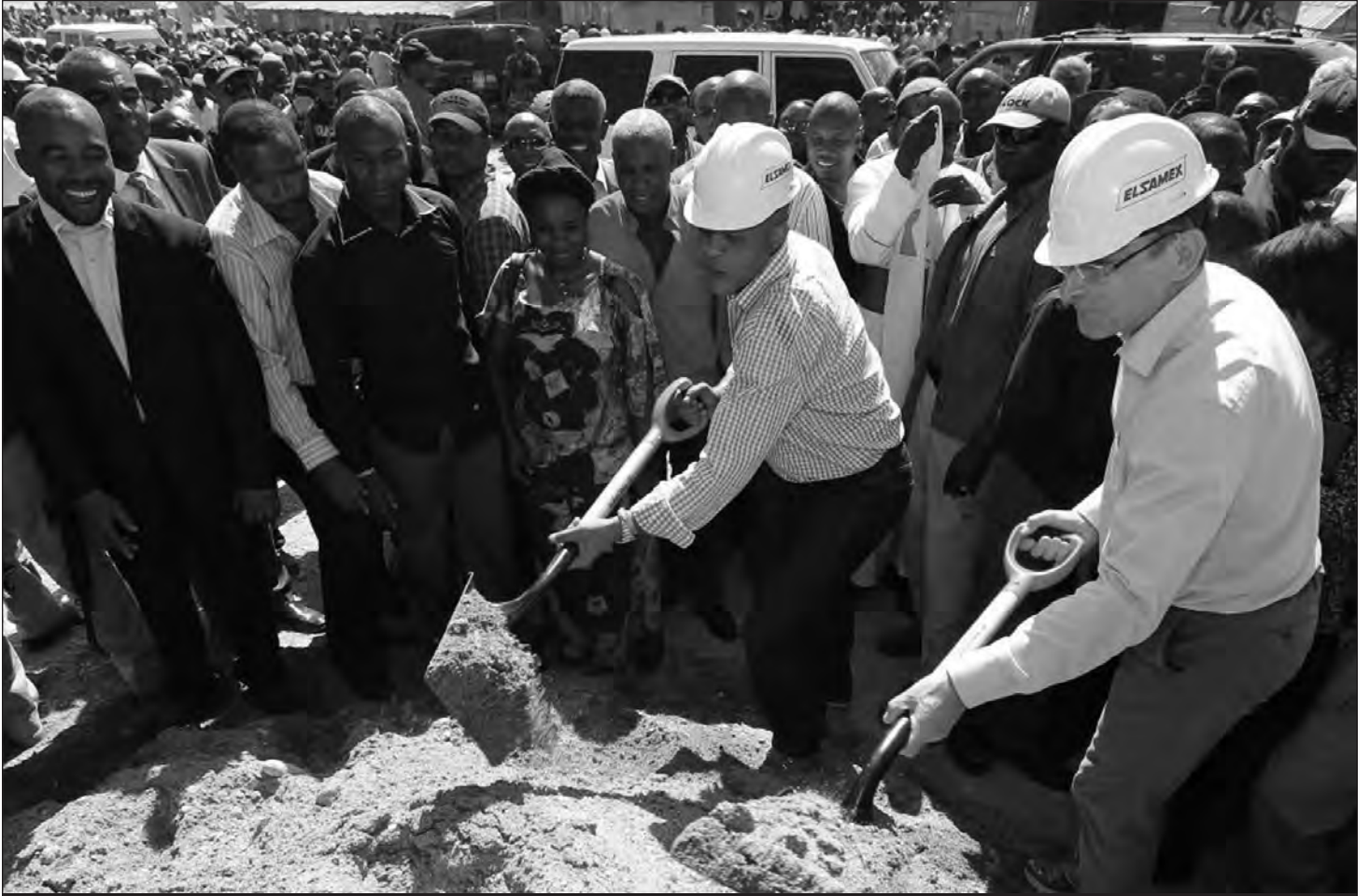
Armés pour éradiquer la pauvreté ou juste pour construire des routes ? Le Président Michel Martelly et Andris Piebalgs, le Commissaire au Développement de l'UE lancent les travaux sur le troisième tronçon de la Route Nationale 3, financée par l'UE, reliant Hinche à Cap Haïtien.

Le développement européen : trouver la bonne voie