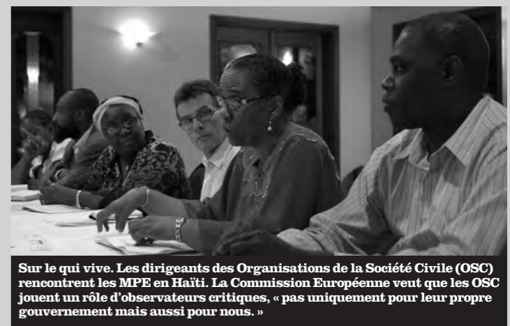
Sur le qui vive. Les dirigeants des Organisations de la Société Civile (OSC) rencontrent les MPE en Haïti. La Commission Européenne veut que les OSC jouent un rôle d'observateurs critiques, « pas uniquement pour leur propre gouvernement mais aussi pour nous. »